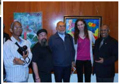
ADAVA exhibiting as part of the Artstroll 2009