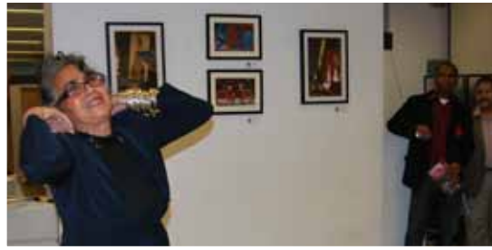
ADAVA exponiendo como parte del Paseo de las Artes 2009